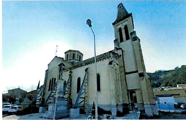
L'église Notre-Dame de l'Assomption du Teil (mars 2023).

Fragilisée par le séisme de 2019, l'église de la commune du Teil, en Ardèche, est en cours de démolition. Une nouvelle église doit être reconstruite à quelques mètres, dont l'ouverture est prévue pour Noël 2025.