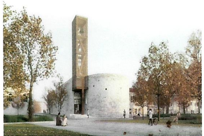
La nouvelle église du Teil

Les pierres de l'ancienne église serviront à reconstruire une partie de l'édifice, dont le clocher abritera les deux anciennes cloches. Les statues en bois doré, inscrites aux Monuments historiques, trouveront leur place à l'intérieur, tout comme les vitraux retaillés. « Deux baptistères sont aussi en cours de restauration, ajoute Pierre Grillet et du marbre présent dans l'ancienne église sera aussi réutilisé ». Le nouvel édifice devrait accueillir sa première messe à Noël 2025. Un vrai symbole d'espérance pour une commune très attachée à son patrimoine religieux. Une autre église du Teil, vieille d'un millénaire, a elle aussi été abîmée par le séisme et est en cours de restauration.