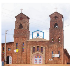
Evangélisation et catéchèse