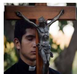
Prêtres pour demain